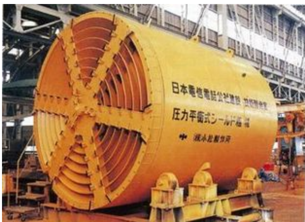
図2 圧力平衡式シールド工法

止水性に優れた圧送排土装置、堀削土砂の後続台車までのパイプ輸送等の特徴とする土圧式シールド工法