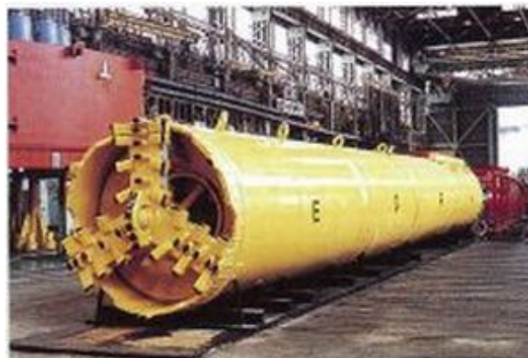
図3 小断面シールド (M-2) 工法 (1988)

高強度かつ耐久性に優れたレジンモルタルを自動打設し、長距離・急曲線施工を可能としたトンネル工法